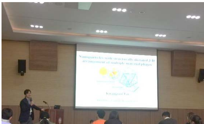
이광렬 교수님 (고려대)