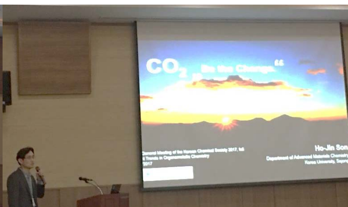
손호진 교수님 (고려대)