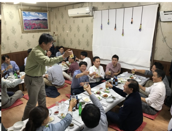
총회 후 만찬