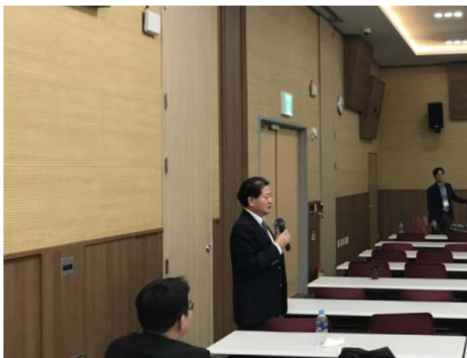
차년도 무기분과 회장 인사