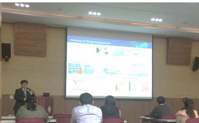
신현석 교수님 (UNIST)