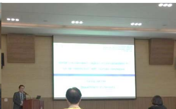
이승재 교수님 (전북대)