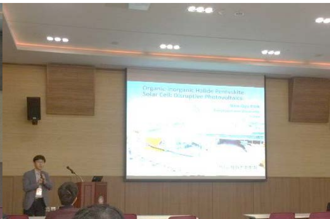
박남규 교수님 (성균관대)